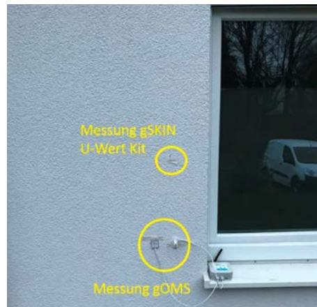
Messaufbau innen (links) und aussen (rechts) an der Aussenwand.

Vom Minergie-Standard verlangte Werte werden oft mit teuren Hochleistungsdämmstoffen erzielt. Leider kommt es vor, dass diese unsachgemäss angewendet werden oder Baufirmen günstigere (d.h. schlechtere) Dämmmaterialien verwenden als deklariert, wodurch der geforderte U-Wert von 0,15 W/(m 2 K) nicht erreicht wird.